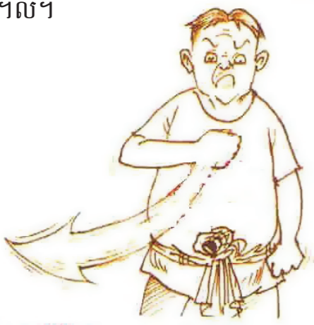
មូលហេតុអ្វីដែលបង្កអោយមានអំពើហិង្សា?

៤. អំពើហិង្សាផ្លូវភេទ មានដូចជា៖ ការបង្ខំឱ្យរួមភេទ ការ ចាប់រំលោភ បទប្រទូស្តកេរ្តិ៍ខ្មាស ការបង្ខំឱ្យរៀបការ ឬរុករាន ផ្លូវភេទ...។ល។